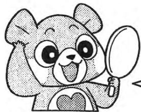
けんこうくまちゃん